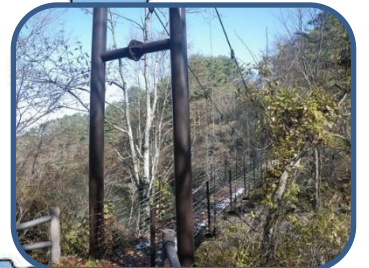
④ 桧原湖に架かる吊り橋