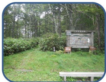
①デコ平駐車場からスタート