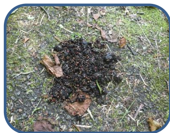
②ツキノワグマの糞