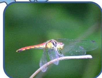
④マユタテアカネ 長峯舟付

裏磐梯ビジターセンター (福島県耶麻郡北塩原村) TEL: 0241-32-2850 開館時間: 9:00~17:00 (4~11月) 休館日: 夏休み期間(8月31日まで)は毎日開館