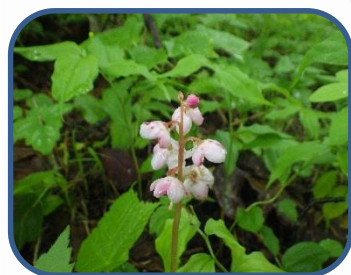
①ベニバナイチヤクソウ