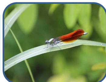
⑤ニホンカワトンボ