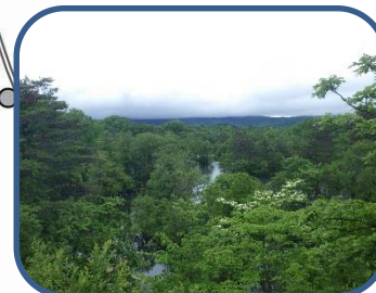
④展望台からの景色