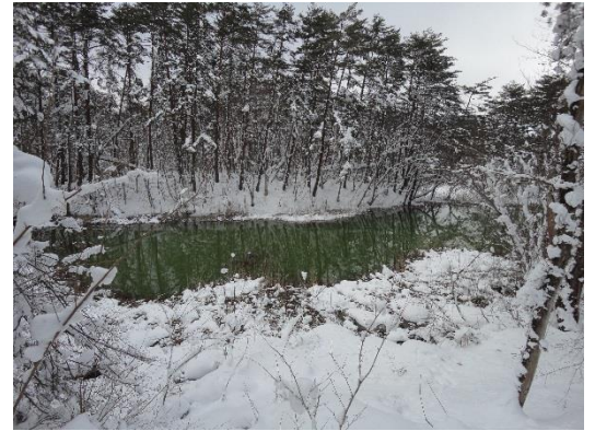
▲冬でも凍らない赤沼

スノートレッキングのシーズンが到来しました。スノーシューを履いて凍る、凍らない五色沼湖沼群のそれぞれの沼の姿を楽しんでみませんか。