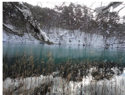
▲凍らない毘沙門沼の東側