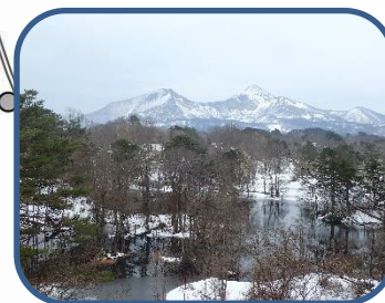
⑤中瀬沼展望台から