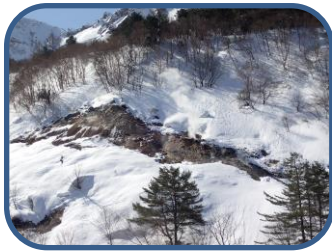
③噴気が立ち上るところ