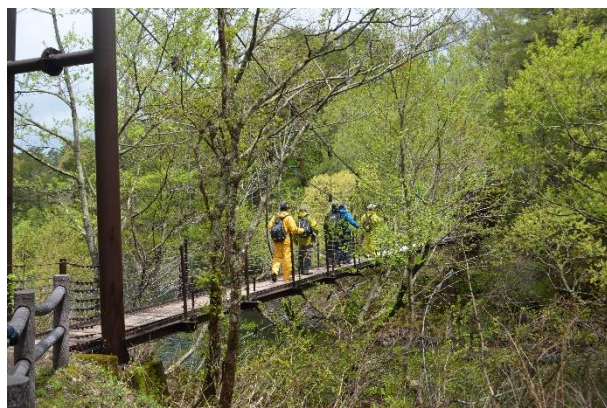
▲吊り橋を渡っているところ