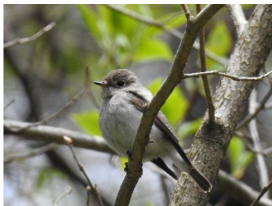
◀ニューナイスズメ (左上)、イスカ♂ (右上) コゲラ (左下)、コサメビタキ (右下)