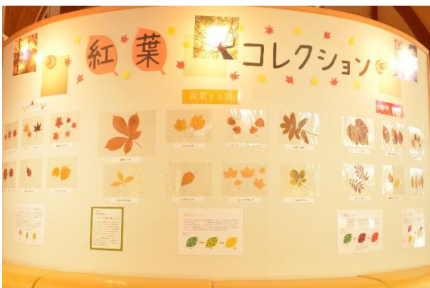
▲紅葉の展示（紅葉コレクション）

秋の代名詞でもある紅葉やキノコ、また裏磐梯で確認されている赤トンボについての展示が登場しました。紅葉の仕組みや種類、キノコの生活史、裏磐梯で確認されている赤トンボの見分け方などを解説しています。今後もどんどん秋の展示に更新予定ですので、ぜひ散策の前後にお立ち寄りください。