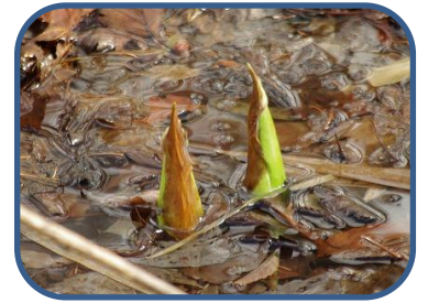
⑦ミズバショウの芽

裏磐梯ビジターセンター (福島県耶麻郡北塩原村) TEL: 0241-32-2850 開館時間: 9:00~16:00 (12~3月) 休館日: 毎週火曜日 (祝日の場合、翌日が振替休館)