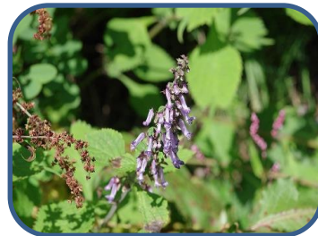
②カメバヒキオコシ