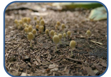
③探勝路上のキノコたち