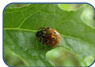
⑥ウンモンテントウ

裏磐梯ビジターセンター (福島県耶麻郡北塩原村) TEL: 0241-32-2850 開館時間: 9:00~17:00 (4~11月) 9:00~16:00 (12~3月) 休館日: 毎週火曜日 (祝日の場合、翌日が振替休館)