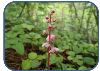
③ベニバナイチヤクソウ