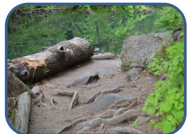
②すれ違う場合には譲り合ひましょう