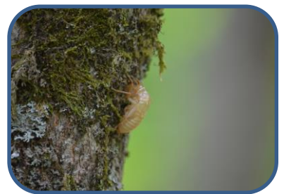
⑥エゾハルゼミの抜け殻

裏磐梯ビジターセンター (福島県北塩原村) TEL: 0241-32-2850 開館時間: 9:00-17:00 (4月~11月) 休館日: 毎週火曜日 (祝日の場合、翌日が振替休館)