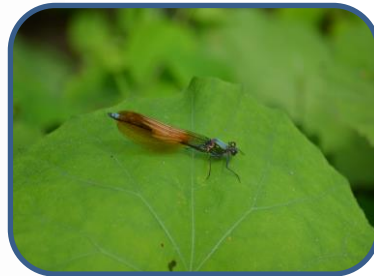
⑤ニホンカワトンボ