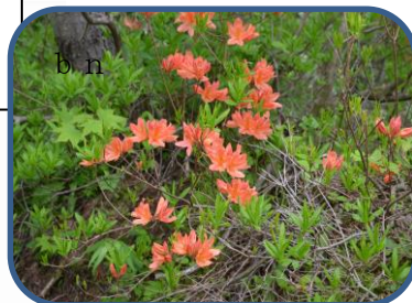
①ビジターセンターのすぐ近くのレンゲツツジ