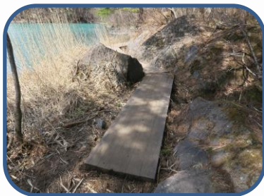
② 木道にはほとんど雪がありません