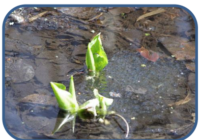
⑦ ミズバショウはいつ咲くのでしょうか？

裏磐梯ビジターセンター (福島県北塩原村) TEL: 0241-32-2850 開館時間: 9:00-17:00 (4月~11月) 休館日: 毎週火曜日 (祝日の場合、翌日が振替休館)