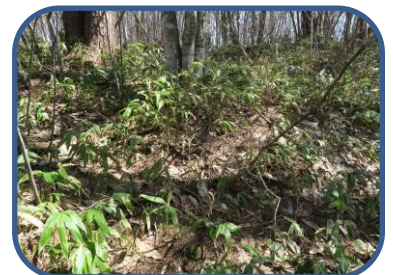
④ ササの葉が一面に広がっています