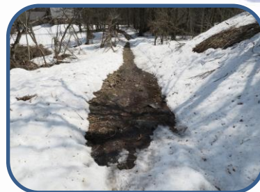
⑤ 雪が残っている場所もあります