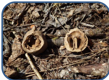
⑥ クルミが食べられた痕