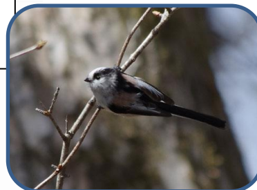
① くりくりした目が可愛いエナガ